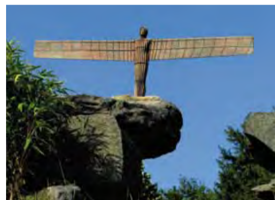
Anthony Gormley, Angel of the North, 1995, brons

De maand mei is ideaal voor een uitstapje naar onze burens aan de overkant van het Kanaal. Dankzij onze samenwerking met Sotheby's kan The Art Society nog eens op bezoek gaan in het prestigieuze domein van Chatsworth (Devonshire), eigendom van de hertogen van Devonshire. Het prachtige park, ontworpen door Capability Brown, vormt het decor voor een tentoonstelling van monumentale moderne sculpturen en werk van belangrijke recente hedendaagse kunstenaars. Ook de privécollectie van Chatsworth is zeer waardevol. Ze beslaat een periode van meer dan 4000 jaar. De hertogen onderhielden vaak rechtstreekse contacten met kunstenaars en dat geldt ook voor de huidige Hertog van Devonshire. Hij liet bijvoorbeeld een reeks familieportretten maken door Lucian Freud. Een verrassingsprogramma dat u te gelegener tijd zal worden meegedeeld.