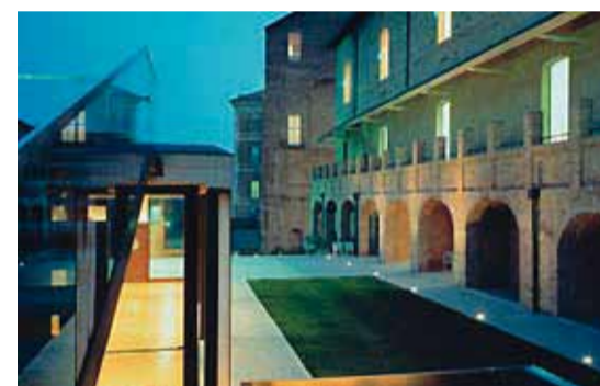
Castello di Rivoli

een tentoonstelling en stadsfestival rond hedendaagse kunst in privéwoningen, tuinen, publieke ruimtes en musea. Geïnspireerd op Jan Hoets Chambres d'Amis uit 1986 wil de tentoonstelling een platform bieden aan hedendaagse kunst en kunstenaars, waarbij de dialoog wordt aangegaan met de omgeving en de bewoners. Sleutelbegrippen zijn integere betrokkenheid, dialoog, cultuur- en generatieoverschrijding. De titel verwijst in de symbolische zin naar een 'bezette stad'. Een vijftigtal kunstenaars uit binnen- en buitenland, zowel gereputeerde kunstenaars als jong talent, werkzaam in verschillende disciplines, zullen aan de tentoonstelling deelnemen onder het curatorschap van beide befaamde gevestigde waarden in de kunstwereld.