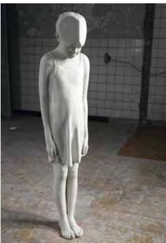
Sofie Muller, Alice , 2008, 143 x 32 cm, epoxymarmer, © Geukens & De Vil / Sofie Muller