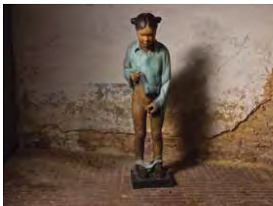
Sofie Muller, Shemale child , 2006, 133 x 30 cm, gepatineerd brons, © Geukens & De Vil / Sofie Muller

Het plastisch oeuvre van Sofie Muller ontwikkelt zich rond een complexe verhaallijn van lichamelijke, sekse, identiteit en transformatie. Verlangen of tekort, norm en uitsluiting vormen de tegengestelde en vaak terugkerende begrippenparen die de grenzen van haar personages suggereren. Haar werken roepen vaak het tegenstrijdige gevoel op van een 'pijnlijke schoonheid'. Mooie en verleidelijke vormen zijn veelal de dragers van pijnlijke ervaringen, maar precies in deze kwaliteit overstijgen ze een spanningsloze esthetiek.