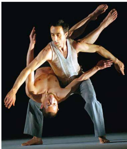
Impromptus van Sasha Waltz, BAM Opera House

In december hebben we afspraak in Brugge voor diverse boeiende activiteiten georganiseerd in het kader van het stadsfestival Brugge Centraal . De stad wordt ingepalmd door creatievelingen van eigen bodem en artiesten uit Centraal-Europa. Een van de blikvangers van het festival is het hedendaagse kunstparcours Luc Tuymans: Een visie op Centraal-Europa . Luc Tuymans is een van de belangrijkste hedendaagse kunstenaars van zijn generatie. Vanuit zijn fascinatie voor de bewogen geschiedenis van Centraal-Europa maakt hij een eigenzinnige tentoonstelling. Een dertigtal spraakmakende kunstenaars uit die regio toont werk met een uitgesproken visie op de maatschappij. Net als Tuymans gaan ze thema's als oorlog, geweld en trauma niet uit de weg. Een van de focuspunten is de animatiefilm, een genre waar Centraal-Europa sterk in is en dat steeds meer tot de kunstwereld doordringt. Er is werk van internationaal befaamde animatiekunstenaars te zien langs vijf locaties in de stad. Daarna plannen we een rondleiding in het Concertgebouw met oog voor de permanente verzameling, een steeds groeiende collectie kunstwerken, die even speels en divers als diepzinnig zijn. Ten slotte gaan we 's avonds naar een hedendaagse dansvoorstelling, een buitenkans voor de leden van The Art Society.