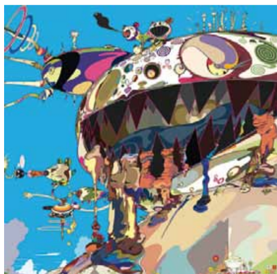
Image by Takashi Murakami.

schildertechnieken van de nihon-ga, maar zijn stijl is sterk beïnvloed door de wereld van de manga's en de otaku's. Hij werd vooral bekend dankzij zijn terugkerende personages in de vorm van gigantische ballonnen of glasvezelstructuren, maar ook door zijn reeksen behangpapier met motieven van lachende bloemen en paddenstoelen. Deze kunstenaar wordt zowel bewierookt als verguisd, en maakt aanspraak op de erfenis van Andy Warhols the Factory , omdat ook hij er niet voor terugdeinst het eigen werk uit te brengen in de vorm van gangbare merchandising. Naast de tentoonstelling en het Kasteel van Versailles bezoeken we ook nog een kunstenaarsatelier.