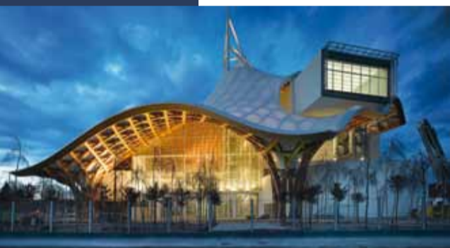
Werf van het Centre Pompidou-Metz, maart 2010, © Shigeru Ban Architects Europe en Jean de Gastines Architectes / Metz Métropole / Centre Pompidou-Metz, foto: Roland Halbe