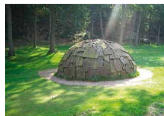
Mario Merz, Igloo di Pietra , 1982, Kröller-Müller Museum

Begin november nemen we u mee op een prachtige reis naar Turijn naar aanleiding van Artissima, de belangrijkste beurs voor hedendaagse kunst in Italië. Turijn is de enige trans-Alpijnse stad met vier instellingen die helemaal gewijd zijn aan moderne kunst (het GAM, het Castello di Rivoli, de Fondazione Sandretto Re Rebaudengo en de Fondazione Merz). De sterkst geïndustrialiseerde stad van