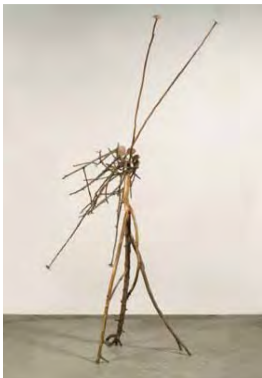
Giuseppe Penone, Unghia e foglia , 1988, MAC's collectie

In januari gaan we op verkenning in de ateliers van een aantal jonge kunstenaars in de regio Antwerpen of Brussel. Op dit parcours, samengesteld op initiatief van een groep curatoren, gaan we op zoek naar jong talent en nieuwe vormen van expressie. Het kan ook uitgroeien tot een uitwisselingsplatform tussen collectieven van jonge curatoren, opkomende kunstenaars en de verzamelaars van The Art Society.