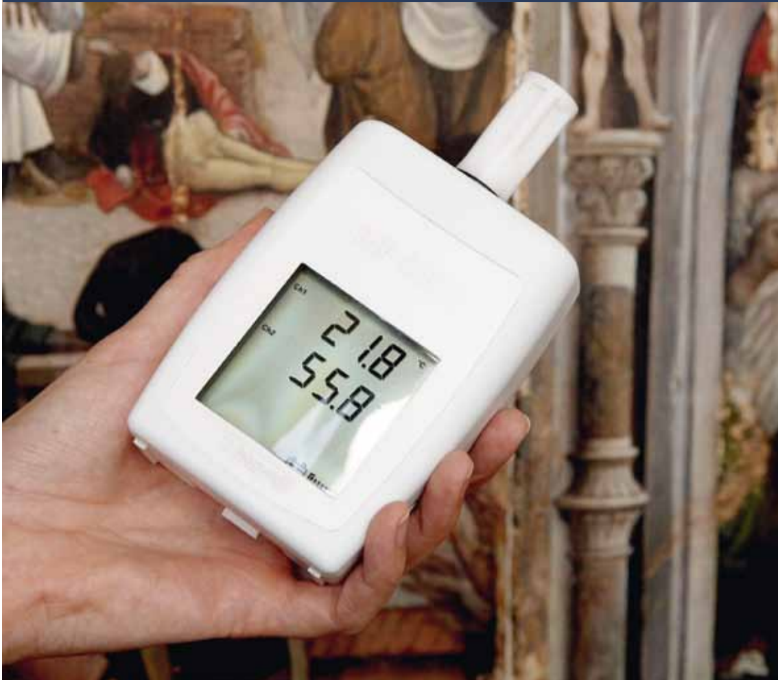
Datalogger met rechtstreekse aflezing van de momentwaarden van T en RV