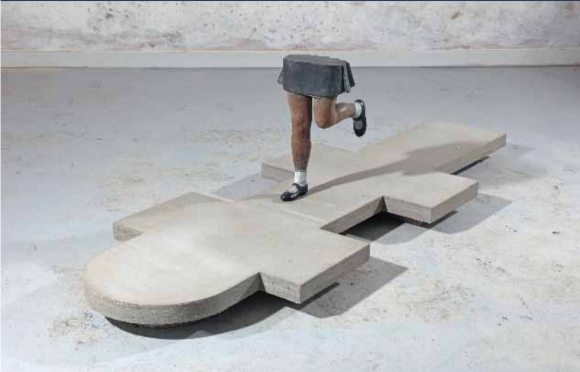
Sofie Muller, Leap of Faith , 2010, 770 x 285 x 200 cm, gepatineerd brons en beton, © Geukens & De Vil / Sofie Muller