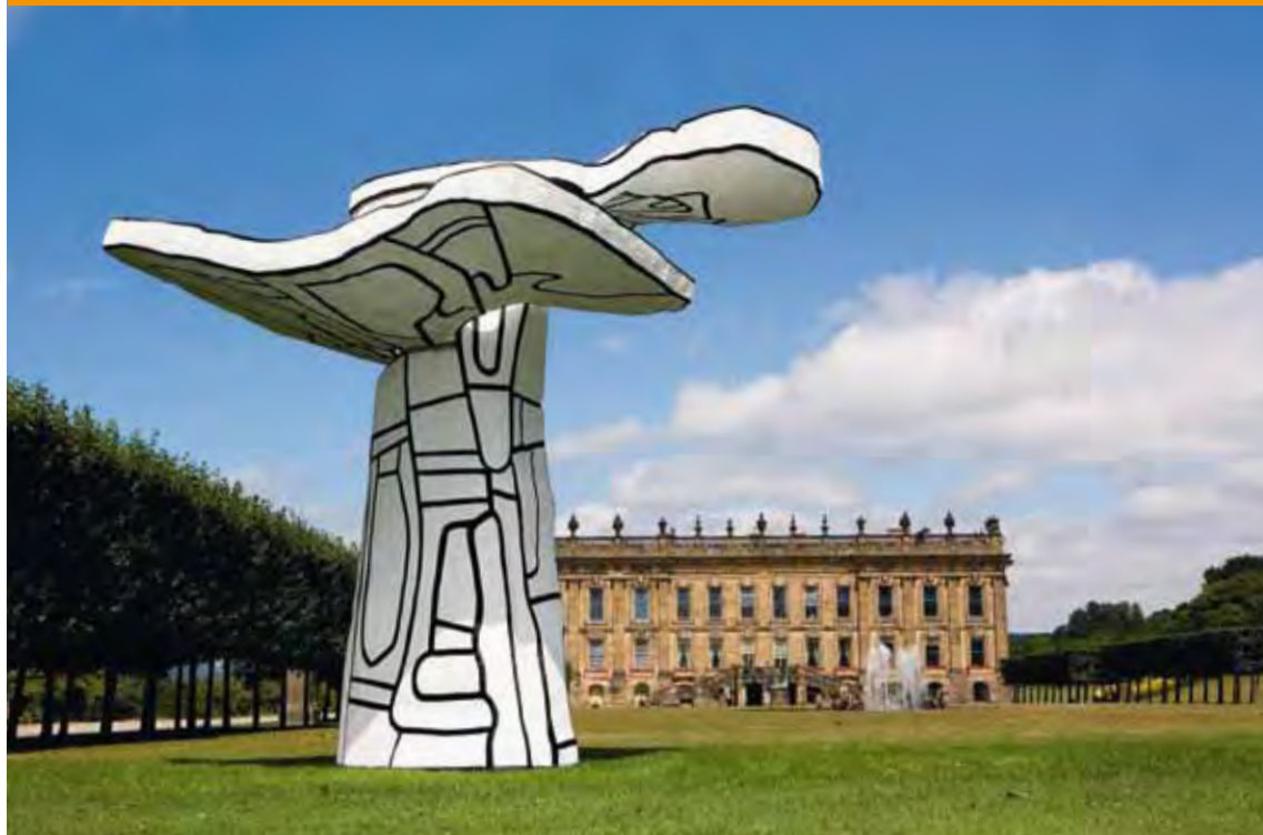
Jean Dubuffet, Arbre Biplan, 1968-69, tentoongesteld in Chatsworth House, Derbyshire